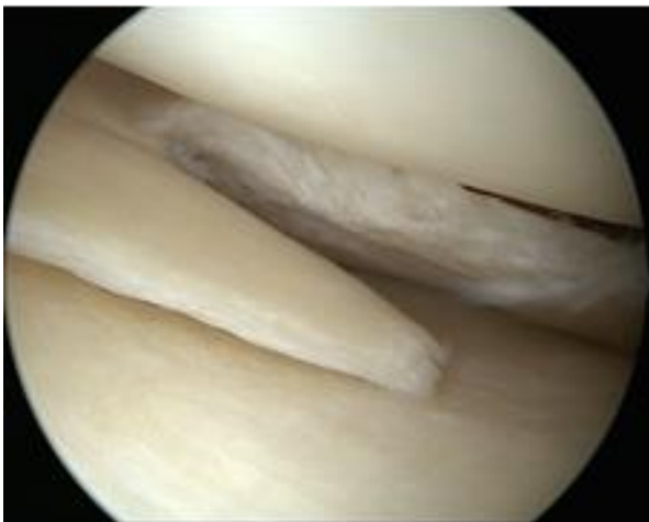
Een gescheurde meniscus, met daarboven en daaronder nog goed kraakbeen zichtbaar van respectievelijk het bovenbeen en onderbeen.

Bij een afwijkende stand van het been (O- en X-benen) kan een correctie-osteotomie (standsverandering) worden uitgevoerd. Bij zeer ernstige beschadigingen en veel klachten kan het gewricht vervangen worden door een kunstgewricht (knieprothese).