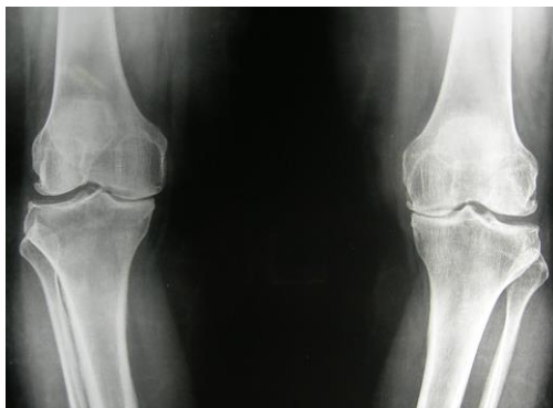
Röntgenfoto van knieën bij patiënt met O-benen. De gewricht spleet aan de binnenkant van de knie is duidelijk versmald, duidend op slijtage.

Overgewicht en zwaar lichamelijk werk veroorzaken geen artrose maar verergeren wel de klachten.