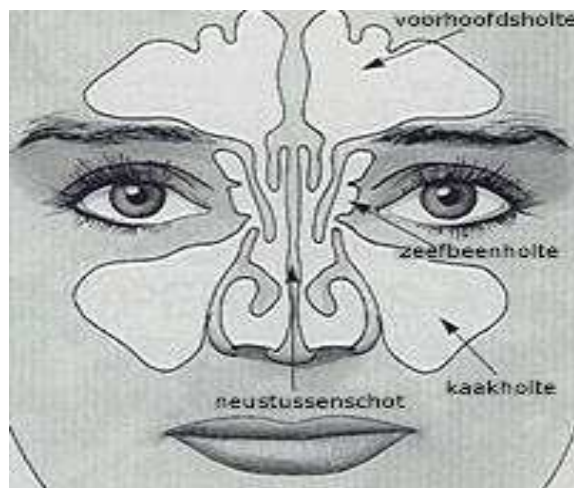
Anatomie van de neus

De neus heeft meerdere functies, één van de bekendste is de neus als reukorgaan. De neus is vooral een onderdeel van de ademhalingsorganen. Het is dus ook van belang dat de neus aan beide kanten goed doorgankelijk is. In de neus wordt de ingeademde lucht verwarmd, bevochtigd en gereinigd. Zo wordt 90% van de deeltjes die onze lucht verontreinigen, door de neus weg gefilterd en onschadelijk gemaakt. De neus levert dus een bijdrage aan een zo goed mogelijke ademhaling. Daarnaast heeft de neus een belangrijke functie bij de stemvorming en verloopt de afvoer van traanvocht via de neus.